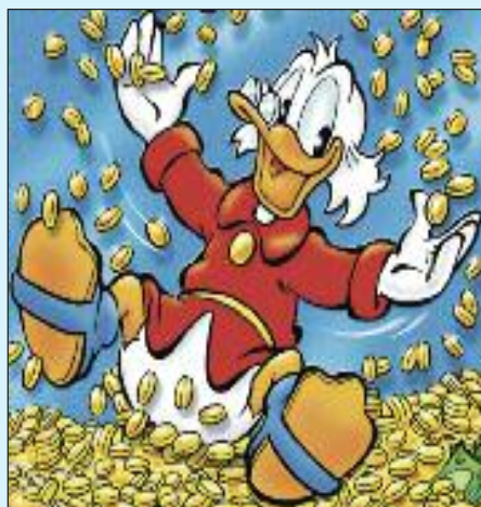
Dagobert Duck macht es vor: Vermögensanlage in Gold ist sehr sicher

Vorurteil: Gold und Silber sind nur eine Anlage für reiche Leute. Es gibt schon 1-Gramm-Barren Gold für