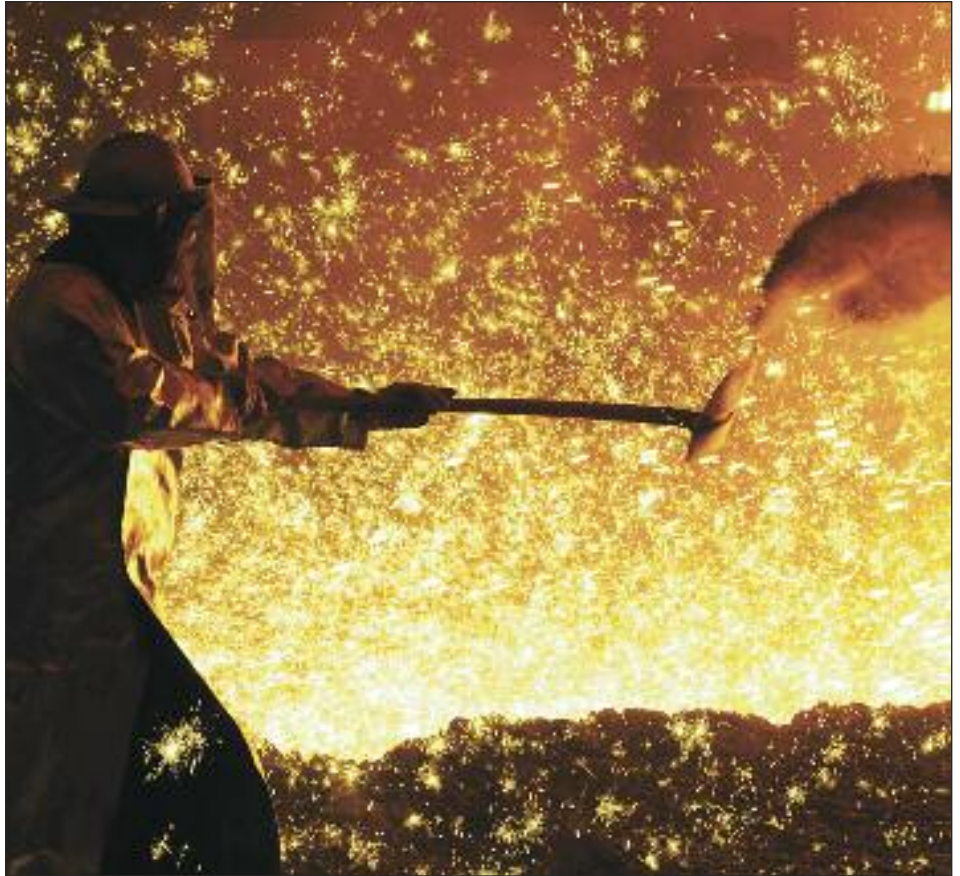
Krisenstimmung in der Stahlbranche: Bricht dieser Pfeiler der deutschen Industrie weg? - Es sieht schlecht aus.