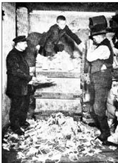
Die Inflation von 1923 – sie führte bei Millionen Sparern zum Totalverlust

Der letzte Anstieg hat mit Unfähigkeit einerseits, der Finanzkrise