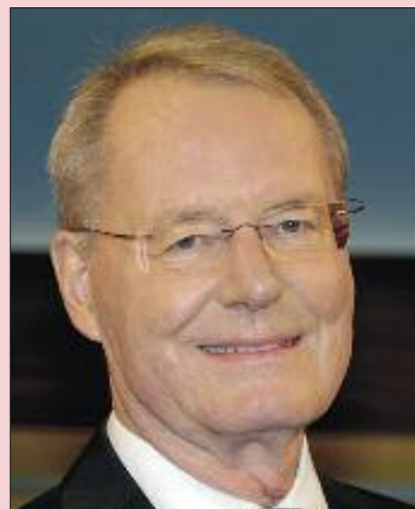
Hans-Olaf Henkel (Ex-BDI-Chef)

Lange wollte es keiner wahrhaben, was Konservative angesichts der dramatischen Staatsverschuldung schon immer gesagt haben: „Das kann doch nicht ewig so weitergehen mit der ganzen Staatsverschuldung.“