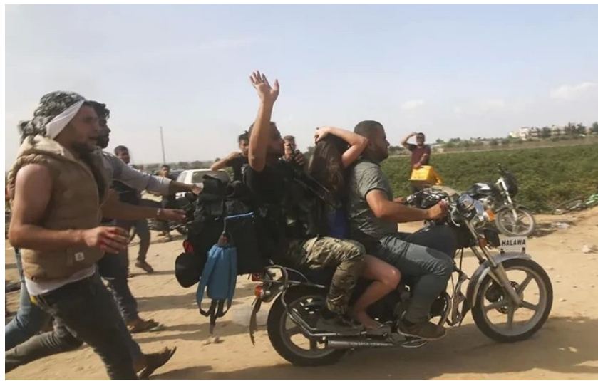
Hamals-Palästinenser bei ihrer Geiselnahme waren nicht durch Uniformen als Kombattanten erkennbar